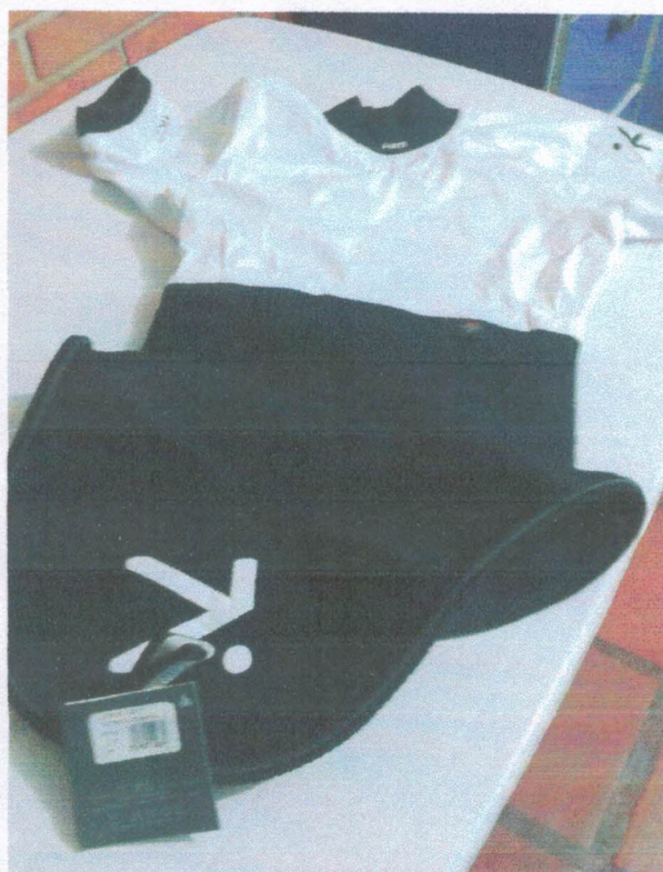
Ação 11.26/AF Eq. Esportivo – Saia (combo manga curta) em neoprene para Slalom