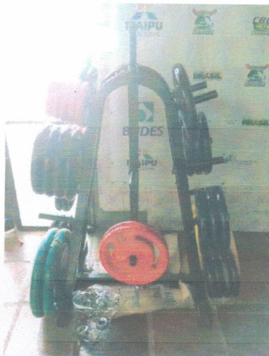
Ação 11.1 e 11.9/AF

Eq. Academia - 300kg – Anilhas; Suporte para anilhas em ferro.