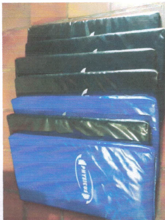
Ação 11.8/AF Eq. Academia – Colchonetes