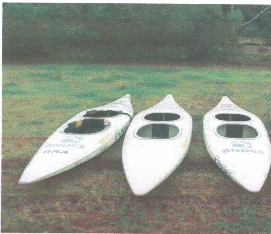
Ação 11.18/AF Eq. Esportivo - Canoas C2