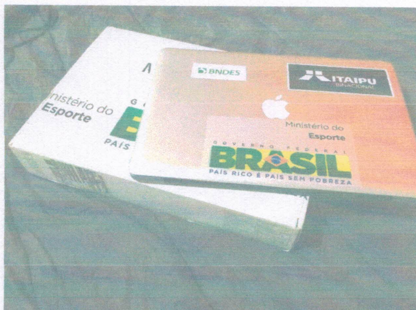
Ação 5.2/AF 02 (dois) Notebooks – MacBook Pro 15