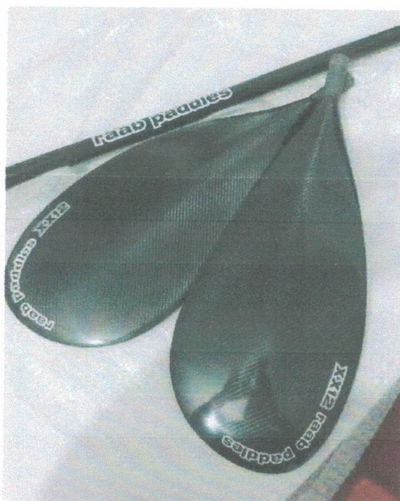
Ação 11.23/AF Eq. Esportivos – Remos caiaque – Carbono