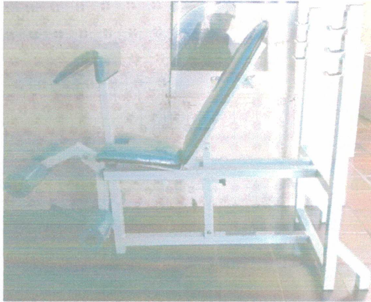
Ação 11.3/AF Eq. Academia - Banco Supino Inclinado