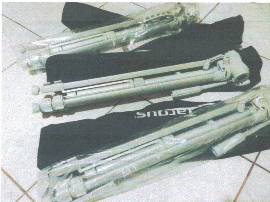
Ação 11.15/AF Eq. Apoio - Tripés para câmera filmadora