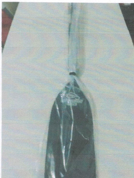
Ação 11.26/AF Eq. Esportivo – Remos Canoa – Carbono