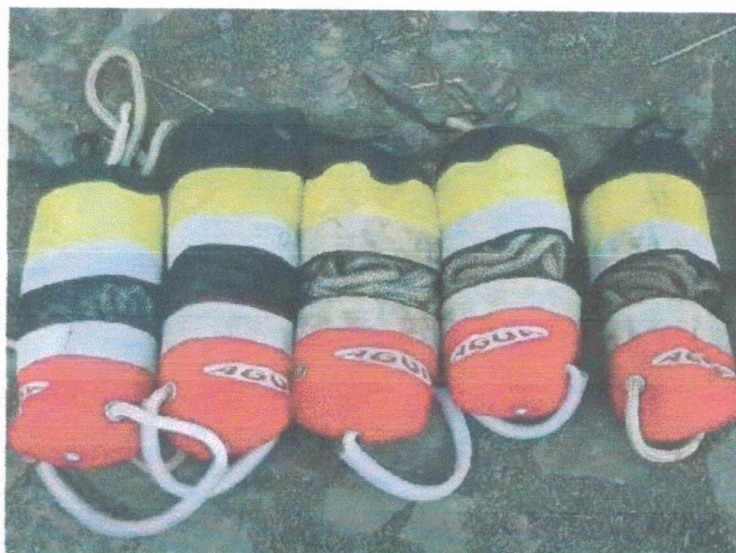
Ação 11.25/AF Eq. Esportivo – Saco de Resgate