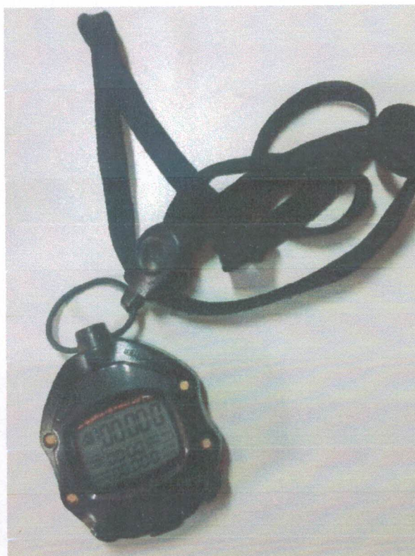
Ação 11.11/AF Eq. Apoio - Cronômetros profissionais