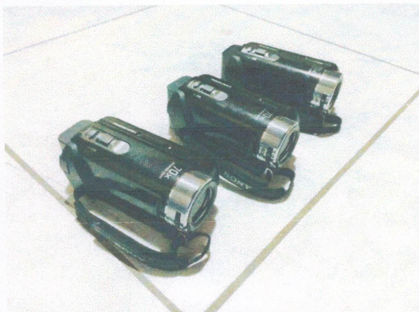
Ação 11.12/AF Eq. Apoio - Filmadoras digitais