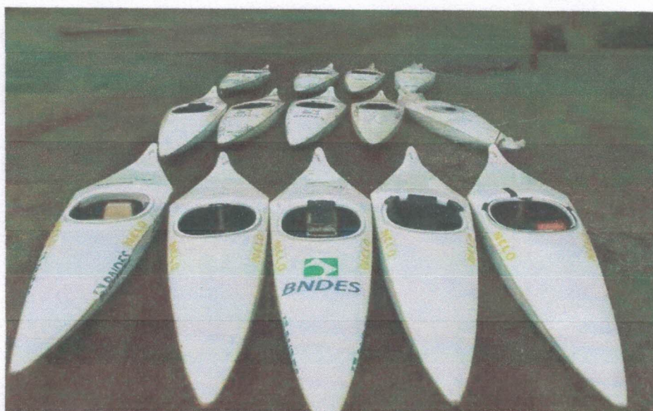
Ação 11.17/AF Eq. Esportivos - Canoas C1