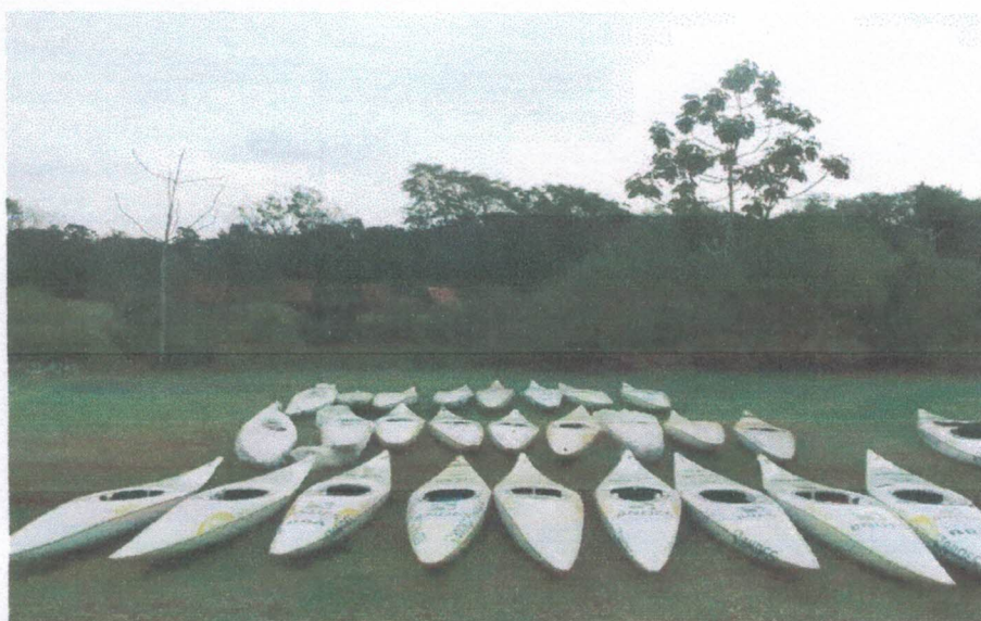
Ação 11.16/AF Eq. Esportivo - Caiaques importados