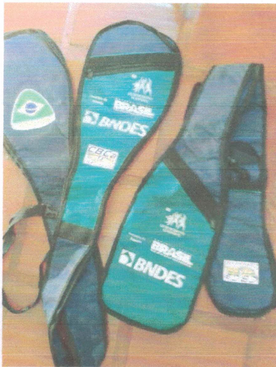
Ação 11.21/AF Eq. Esportivo – Capa de proteção para remos