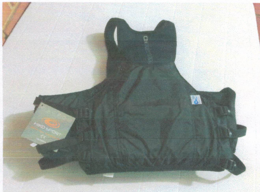
Ação 11.22/AF Eq. Esportivos – Coletes de segurança certificados pela FIC