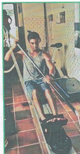
Ação 11.10/AF Eq. Apoio - Caiaque ergômetro