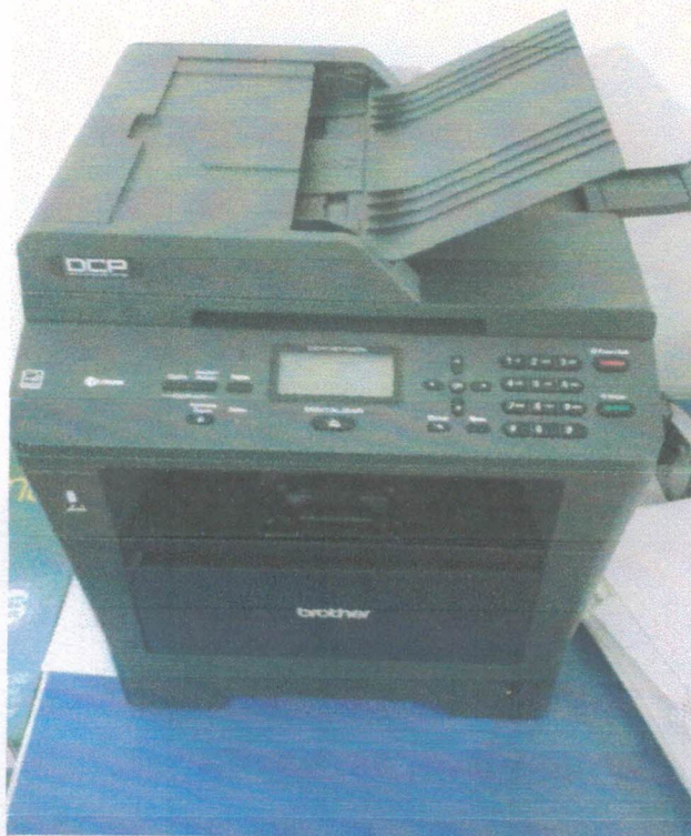
Ação 5.1/AF e 3.1/AM Multifuncional (impressora + scanner)